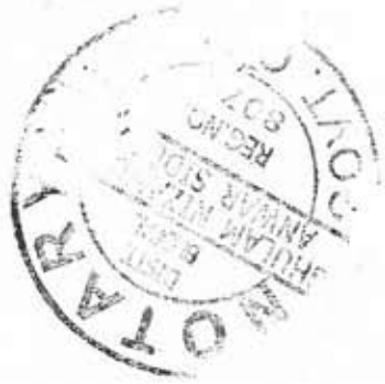
PHOTO COPY ATTESTED [Handwritten Signature] GULAM NIZAMUDDIN ANWAR SINDHUQUI NOTARY & ADVOCATE, BHOPAL

[Handwritten Signature] PRINCIPAL RAJEEV GANESH LITIGATE